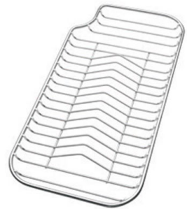
Tellerständer aus Edelstahl 8100 115