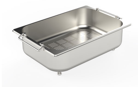
Edelstahl-Nudelsieb 8154 000