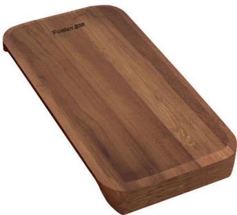
Verschiebbares Schneidebrett aus Iroko-Holz 8643 116