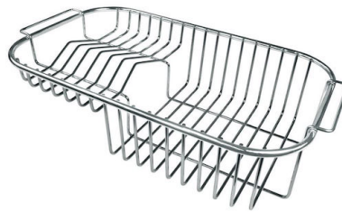
Tellerkorb aus Edelstahl 8100 301