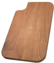
Schneidebrett aus Iroko-Holz 8643 115